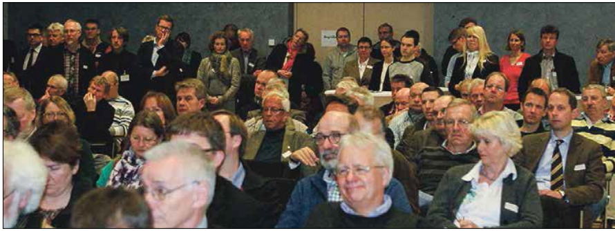
Gut besucht: Rund 180 Teilnehmer waren beim 4. Sportkongress des Regionssportbundes Hannover dabei.

Hereinspaziert ins Forum 1, das den plakativen Titel „Aus 2 mach 1“ trug. Welche Chancen bringt eine mögliche Fusion zweier Sportvereine und wo verbergen sich die Risiken? Während der Jurist Christian Goergens eine Vielzahl rechtlicher Bedingungen und Voraussetzungen aufzeigte, referierten drei Vereinsvertreter über be-